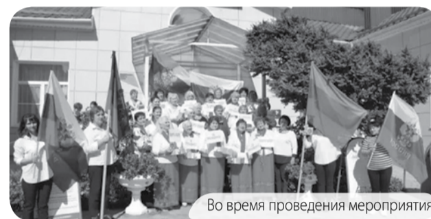
Во время проведения мероприятия.

В начале мероприятия предгорненцев старшего поколения пришли поздравить сотрудники педагогического коллектива детского сада №14 г. Ессентуки, которые передали трогательные подарки, сделанные руками вос-