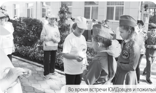
Во время встречи ЮИДовцев и пожилых людей - обслуживаемых Центра.

Текст и фото пресс-служба ГБУСО «Предгорный КЦСОН».