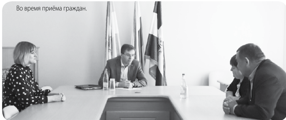
Во время приёма граждан.

Во время личного приёма граждан в Предгорном муниципальном округе министром сельского хозяйства СК Сергеем Измалковым был поднят вопрос по оказанию мер государственной поддержки сельскохозяйственным организациям на возмещение части затрат на проведение агротехнологических работ в области семеноводства.