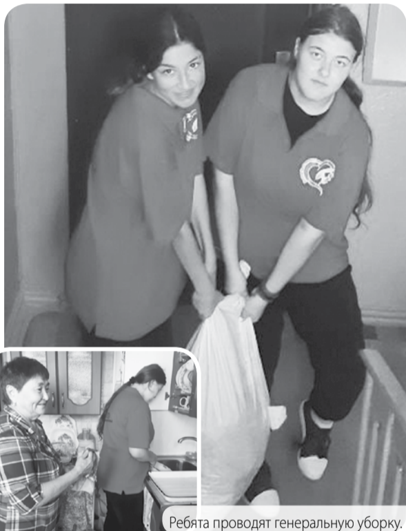
Ребята проводят генеральную уборку.

Волонтеры из посёлка Нежинский протянули руку помощи представителям старшего поколения.